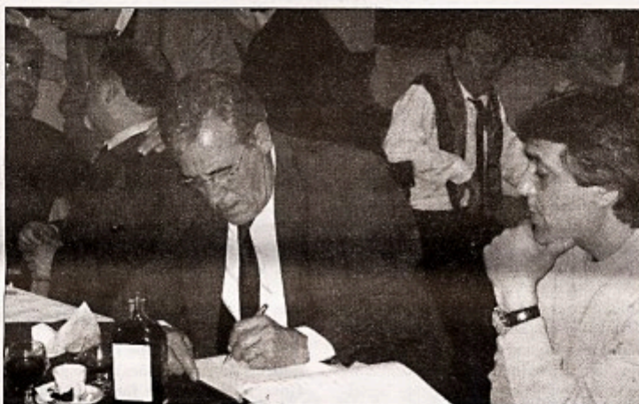
Jerónimo de Sousa no Centro Português de Osnabruck, Alemanha

quando da deslocação de Jerónimo de Sousa à Alemanha e Bélgica.