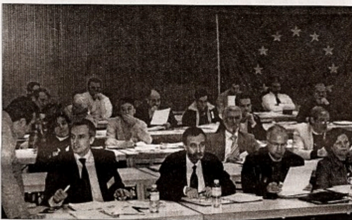
VI Congresso da Confederação da Comunidade Portuguesa no Luxemburgo