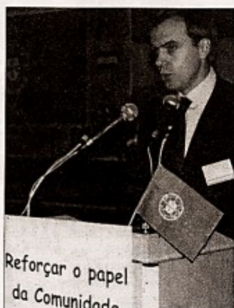
Coimbra de Matos

EM: O programa de acção refere como principal objectivo a integração dos portugueses na sociedade luxemburguesa. Isto quer dizer que vão ficar