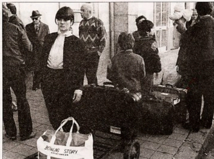
Muitos dos portugueses que hoje emigram estão a sentir na pele a consequência do modelo económico imposto pela globalização capitalista

Foi possível impor alguns recuos na proposta de directiva de liberalização dos serviços que ficou conhecida pelo nome do seu autor Bolkestein (também holandês). Directiva que visa "estabelecer um quadro jurídico que suprima os obstáculos à liberdade de estabelecimento dos prestadores de serviços e à livre circulação dos serviços entre os Estados-membros". Linguagem simpática que significa afinal a liberalização dos serviços públicos e a sua entrega aos grandes grupos económicos, assim como a possibilidade de contratar trabalhadores nos países com salários mais baixos, para os levar a traba-